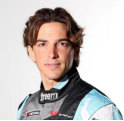
ロベルト メルヒ ムンタン ROBERTO MERHI MUNTAN

生年月日 1993年11月13日 出身地 愛知県 身長 168cm 体重 69.3kg 血液型 RH+O